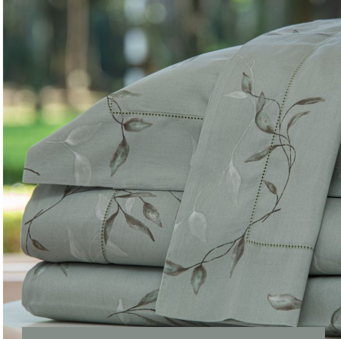
Jogo de lençol BOTÂNICO