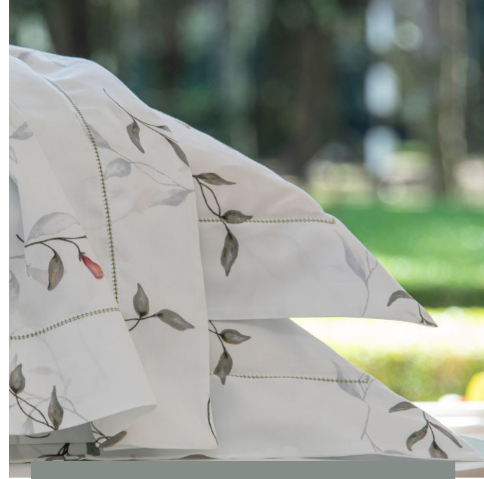
FRONHA AVULSA FLORA