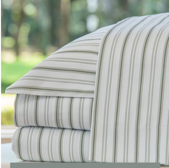
Jogo de lençol AMAZÔNIA