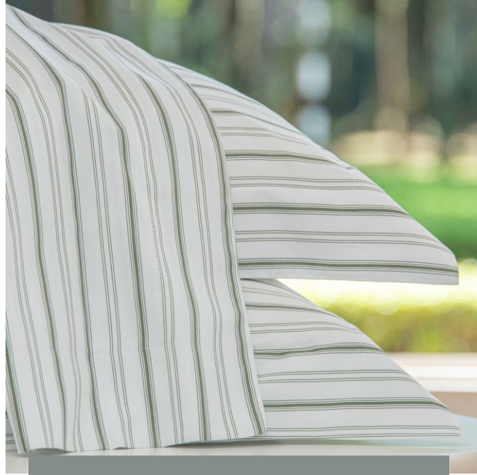
FRONHA AVULSA AMAZÔNIA