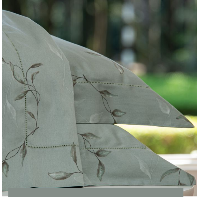
FRONHA AVULSA BOTÂNICO