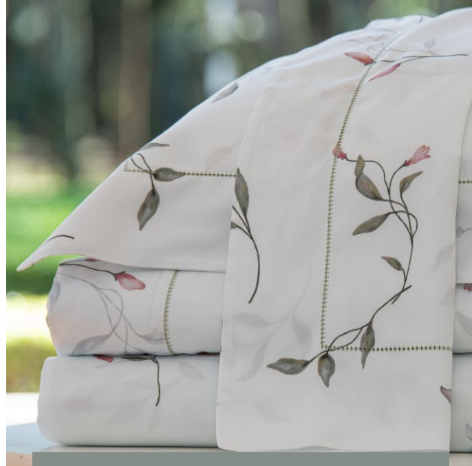
Jogo de lençol FLORA